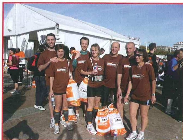
Marathon Nice Cannes - 9 novembre 2008