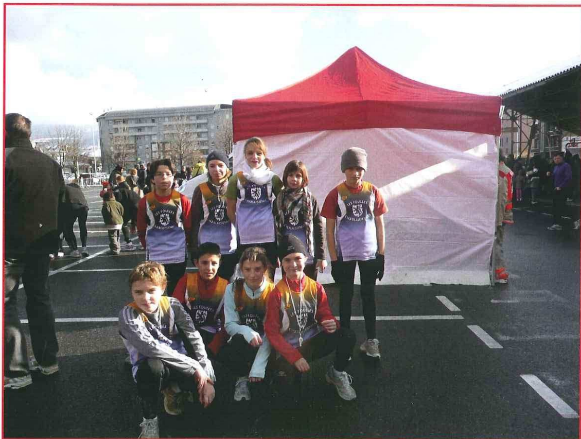
Les « Jeunes » - Foulées Annemassiennes