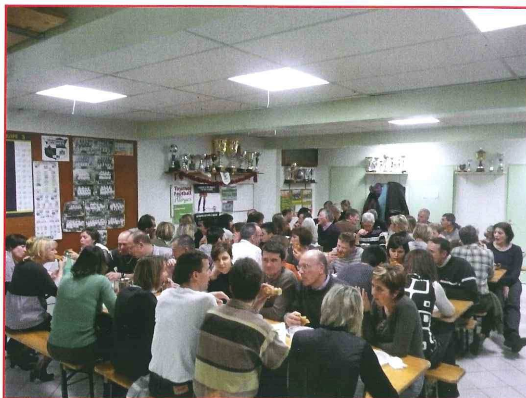
Soirée « Raclette – Galette » - Samedi 19 janvier 2009