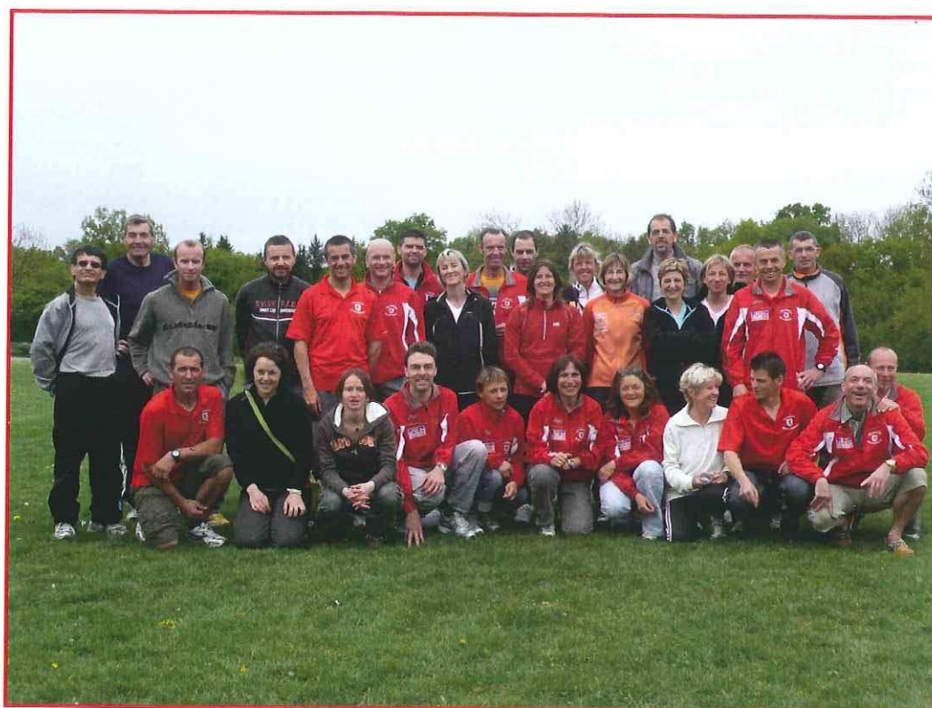
La Tartencelloise – participation massive des Foulées Chablaisiennes